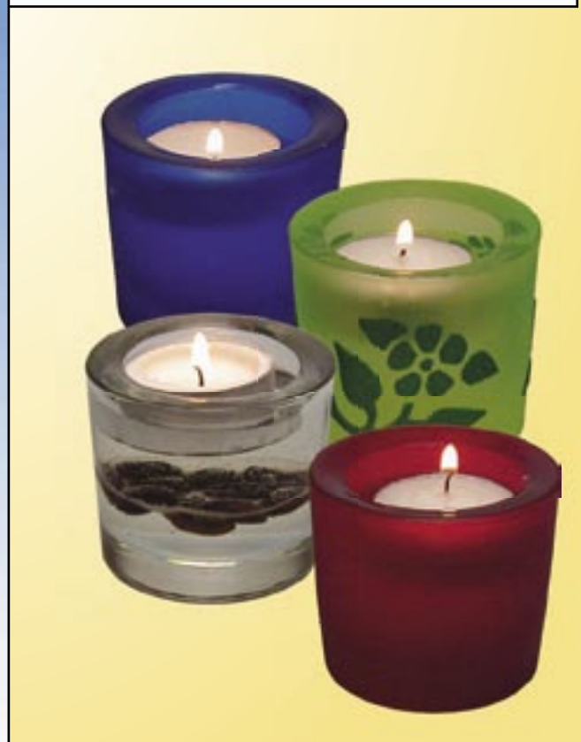
Windlichter aus Glas