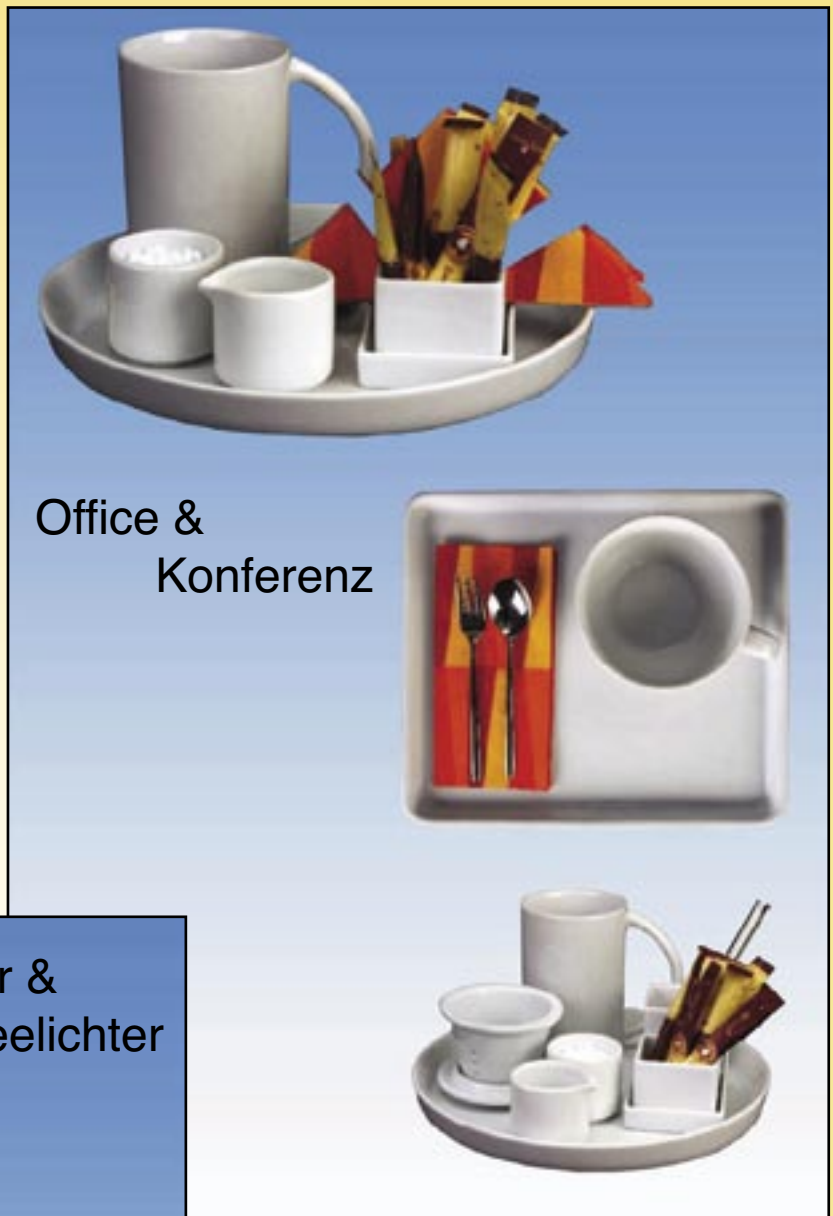
Office & Konferenz

Bringen Sie Ihre Werbung mit uns zum Erfolg!