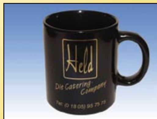
Form Anton schwarz oder blau