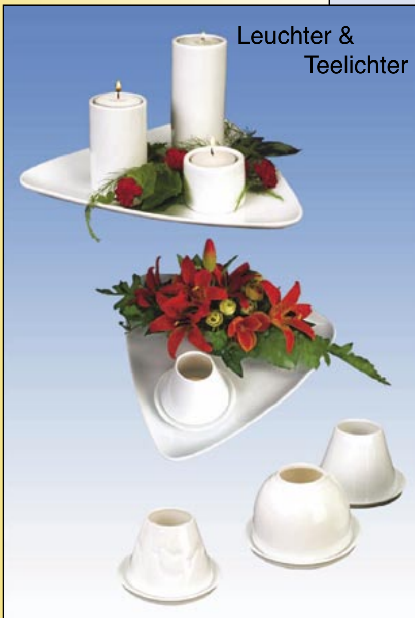
Leuchter & Teelichter