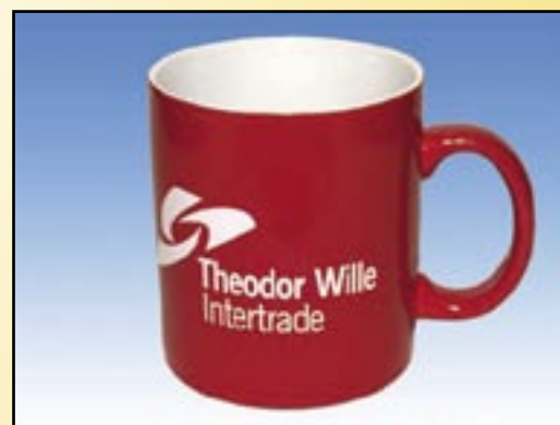
Form Anton rot